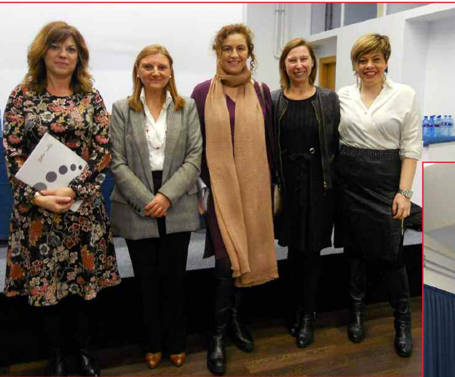
Fórum Gijón Franquicias