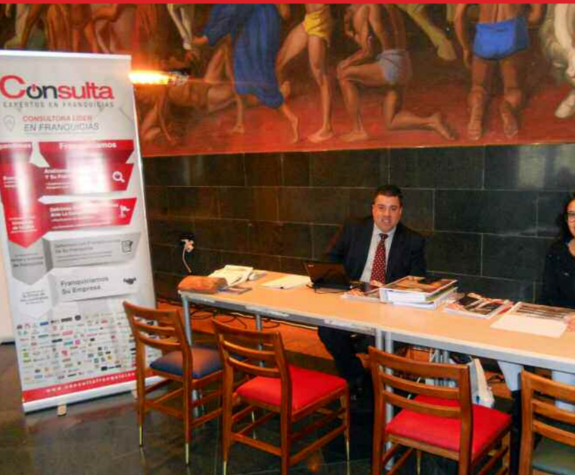
Distintas imágenes previas al acto de inauguración de la Feria AsturFranquicia en su edición 2017 y el Fórum Gijón Franquicias.